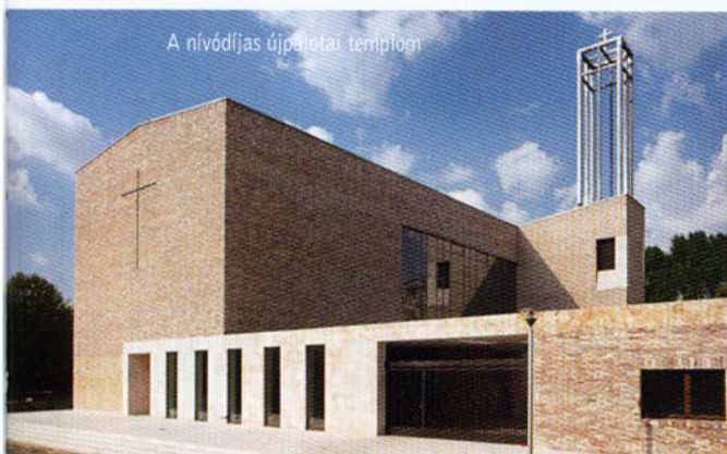
A nivódíjas újpalotai templom