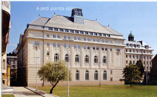
A pesti piarista épület